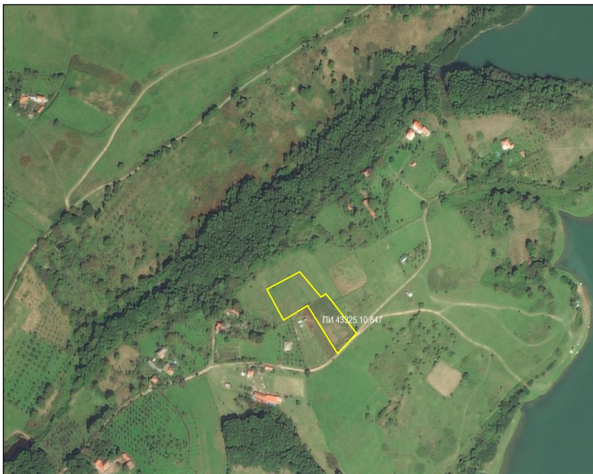
Фиг. 1-01. Сателитна снимка с означено местоположение на ПИ 43325.10.847, землище с. Лесидрен, община Угърчин

Местонахождението на разглежданата територия спрямо околните селища и обекти е представено на Фиг. 1-01 и Фиг. 1-02.